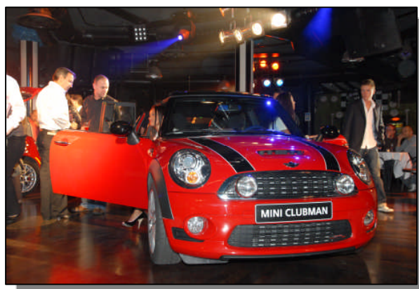
Exemple : lancement de la Mini Clubman avec la société BMW le 19 septembre 2008

Productions artistiques, concerts, soirées de gala, lancement de produits, séminaires, arbres de Noël, repas d'entreprises, eductour... le centre de Loisirs Macumba offre 6000 m 2 d'espaces modulables, 1500 places de parking, 5 restaurants, des espaces de réception ou de congrès, des salles de spectacles ou de cabaret, d'une capacité de 20 à 2000 personnes, une structure exceptionnelle offre les moyens de satisfaire toutes les exigences.